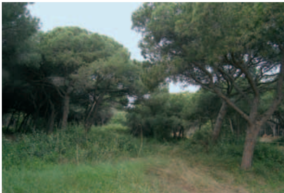
A la foto superior s'aprecien els camins senyalitzats amb cordes. A la pàgina següent, a dalt, foto aèria que situa can Camins, envoltada dels futurs equipaments del Parc Litoral.

algunes d'elles en greu regressió a Catalunya, com el cucut reial, el xot i la xixella. Altres espècies remarcables són les sargantanes, els conills i els ratolins, dels quals podem observar el rastre en forma de pinyes rosegades.